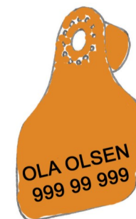
Combi 2000® Mini hulldel, med innsidepreging