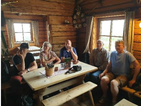
Fint inne i almen

Om vinteren er det populært å renne ned på kjelker, det blir et kappløp. Da er det organisert slik at det er noen klokkeslett det er lov å kjøre opp, og så er det tider som er reservert for kjelker. Veien opp var for bratt for bussen vår, og 22 personer ble stuet godt inn i noen privatbiler.