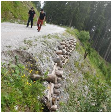
Bratte ller og oppbygd veg