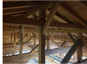
Detaljer fra fjøs, bærende trekonstruksjon, bygget må tåle stor snølast.

Tilskuddet for å kyr på støl er 100 euro, eller vel 1.000 kr pr ku. Ungdyr gir 60, 70 eller 80 euro i tilskudd, etter alder.