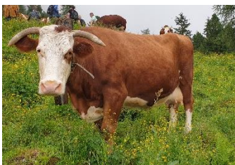
Eldste kua, 18 år, har produsert over 100 tonn melk

Når kyrne skal ned fra stølen bruker de 4 timer, de starter kl 3 om natta, slik at det er kjølig mens dyra går. Når de kommer ned får kyrne hvile, stell og pynting i 2 timer. Klokken 9 er det parade gjennom byen.