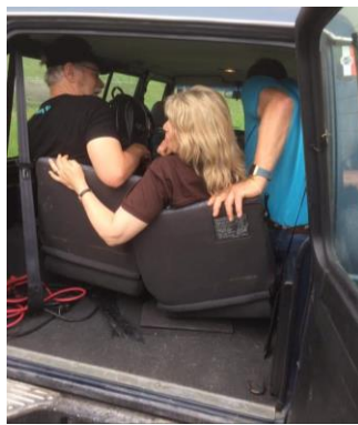
Trangt i bilene