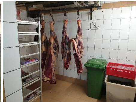
Kjøle og modnings lager