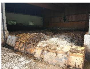
Lager for fast gjødsel

Kalving skjer i november/ desember. Det er fordi at kravet for å få tilskudd til seterdrift gjør at de må være der til i begynnelsen av september. Beitekvaliteten er redusert fra august og utover, derfor passer det at kyrne er i seinlaktasjon.