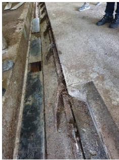
Gjødselrenne med skille for gylle