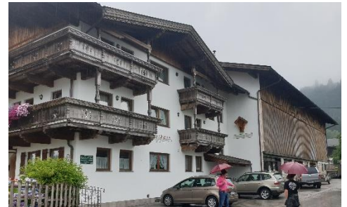
Fjøs og våningshus i ett bygg