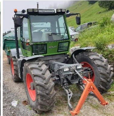
Spesialdesign for bratte forhold