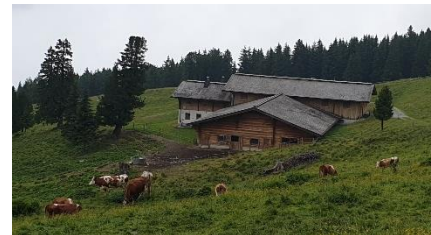
Fjøset ligger fint i terrenget

Areal og kulturlandskapstilskuddet varierer etter hvor bratt det er. I gjennomsnitt er det 250 kr/daa daa. For de bratteste arealene er det oppe i 380 kr/daa.