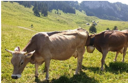
Kyr på beite

Driften starter tidlig om morgenen for at dyra skal gå mens det er noenlunde kjølig. Det er tre store bjeller, disse er stemt i harmoni mot hverandre. Tre lederkyr får hver sin store bjelle på vei opp og ned fra setra. Når de begynner på stigningen slipper kyrne å ha bjellene på.