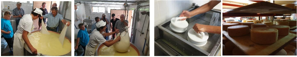
Ostemassen tas opp, presses i former og legges til modning.