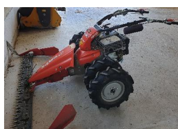
Både to-hjulstraktorer og større maskiner