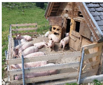
Grisene får myse