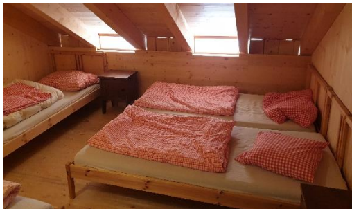
Soverom leies ut på låven

Mysen etter osteproduksjonen ble brukt til å føre slaktegriser.