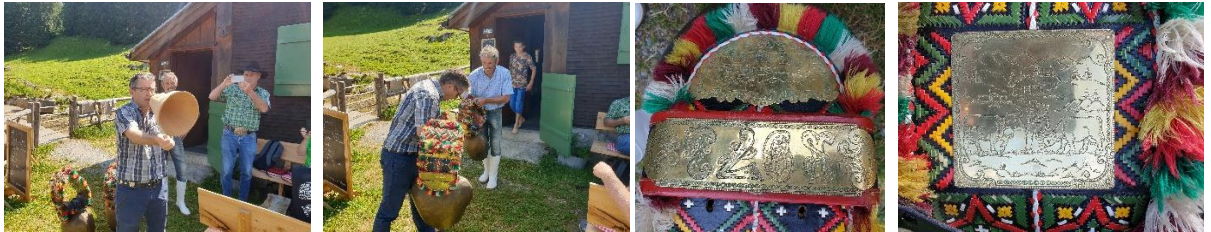
Det ropes ut en bønn hver dag