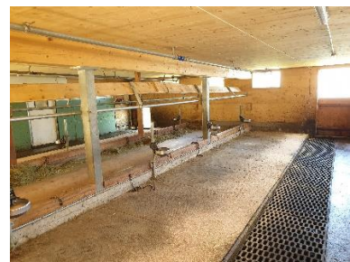
Båsfjøset på setra

Om vinteren blir melken brukt til osteproduksjon, og osten blir solgt enten på COOP eller lokalt. Det blir omtrent en tredel på hver, ost solgt i Alpene, på COOP og lokalt. På setra får de 16 CHF for osten, men på COOP koster den 22 CHF. Hjemmesiden er www.alpsoll.ch