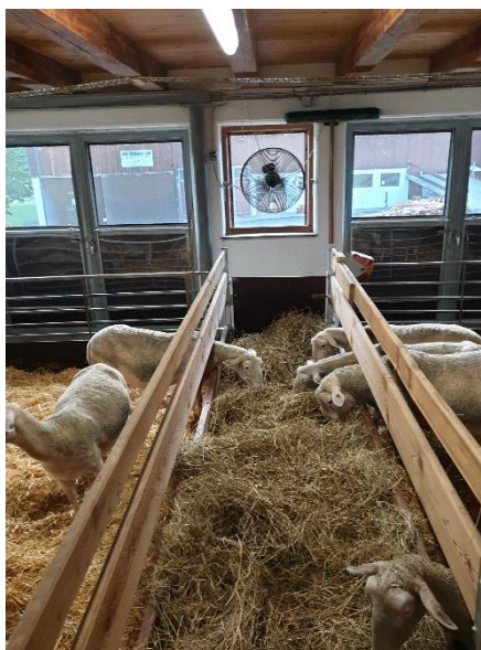
Vifte blåser frisk luft inn over fôrbrettet.